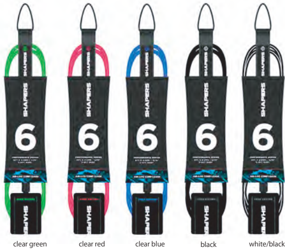
clear green clear red clear blue black white/black

6FT x 3/16" 1.8m x 5.5mm DESIGNED FOR 0-4FT SURF