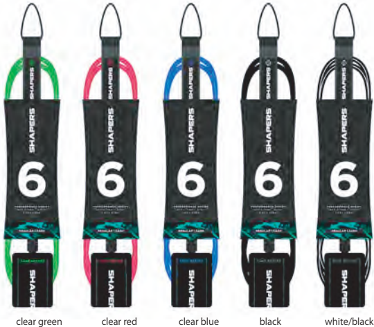
clear green clear red clear blue black white/black

6FT x 9/32" 1.8m x 7mm DESIGNED FOR 0-6FT SURF