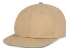
Sand SOLD OUT ORDER ¥4,900 + tax