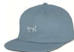
Powder Blue SOLD OUT ORDER N o 2 Cotton ¥4,900 + tax