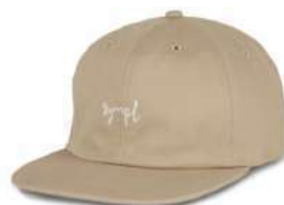
Sand SOLD OUT ORDER ¥4,900 + tax