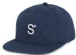
N o 1 NYLON Navy SOLD OUT ORDER ¥4,900 + tax