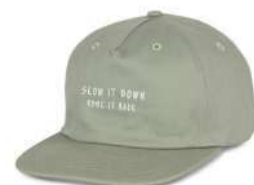
N o 3 Cotton Slate SOLD OUT ORDER ¥4,900 + tax