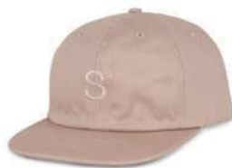
Salmon SOLD OUT ORDER ¥4,900 + tax