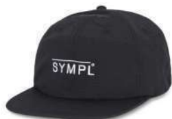
SOLD OUT ORDER ¥4,900 + tax