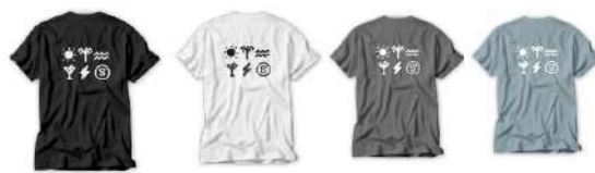
ICON TEE Black S M L White M L SOLD OUT SOLD OUT SOLD OUT Charcoal S M L P. Blue S M L SOLD OUT SOLD OUT SOLD OUT ¥5,400 + tax