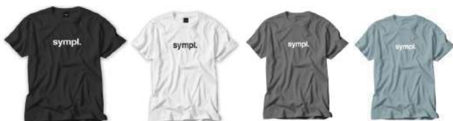
FONT TEE Black S M L SOLD OUT SOLD OUT SOLD OUT White M L SOLD OUT SOLD OUT SOLD OUT Charcoal M L SOLD OUT SOLD OUT SOLD OUT P. Blue M L SOLD OUT SOLD OUT SOLD OUT ¥5,400 + tax