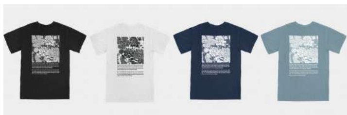
FLORAL TEE Black M L SOLD OUT SOLD OUT SOLD OUT White M L SOLD OUT SOLD OUT SOLD OUT NAVY M L SOLD OUT SOLD OUT SOLD OUT P. Blue M L SOLD OUT SOLD OUT SOLD OUT ¥5,400 + tax