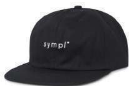
N o 2 Cotton Black SOLD OUT ORDER ¥4,900 + tax